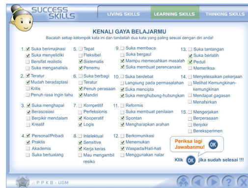
Gambar 9. Tes Gaya Belajar

Latihan lain yang dipaparkan dalam learning skills ini adalah tes gaya belajar. Tes ini disusun oleh DePorter et.al. (1999), yang mengemukakan bahwa secara garis besar gaya belajar seseorang dikategorikan ke dalam 4, yaitu Sekuensial Konkret, Sekuensial Abstrak, Acak Konkret, dan Acak Abstrak. Sebagaimana pengelompokan auditory dan visual, tes gaya belajar ini