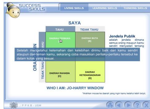
Gambar 2. Jo-Harry Windows