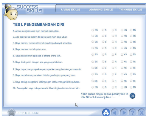
Gambar 12. Pre-Post Test

Tiga sesi pelatihan, living skills , learning skills , dan thinking skills adalah modul yang dapat digunakan secara mandiri oleh mahasiswa atau dapat juga dijadikan materi